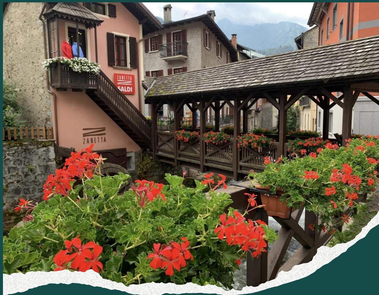
Ponte di Legno (BS)